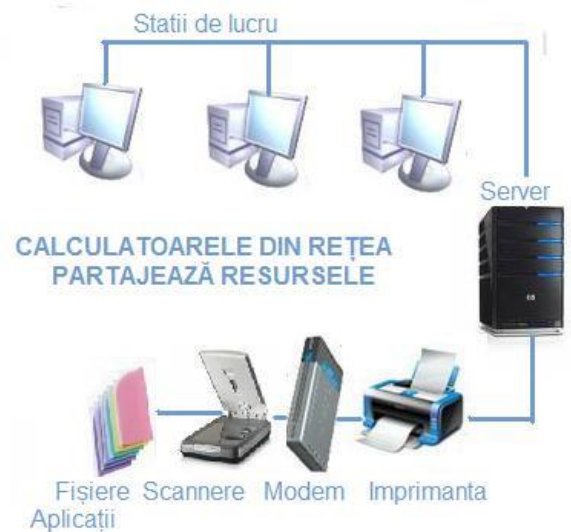
Fig.1.1 Resurse în rețelele de calculatoare

Sunt definite două tehnologii de transmisie a datelor: